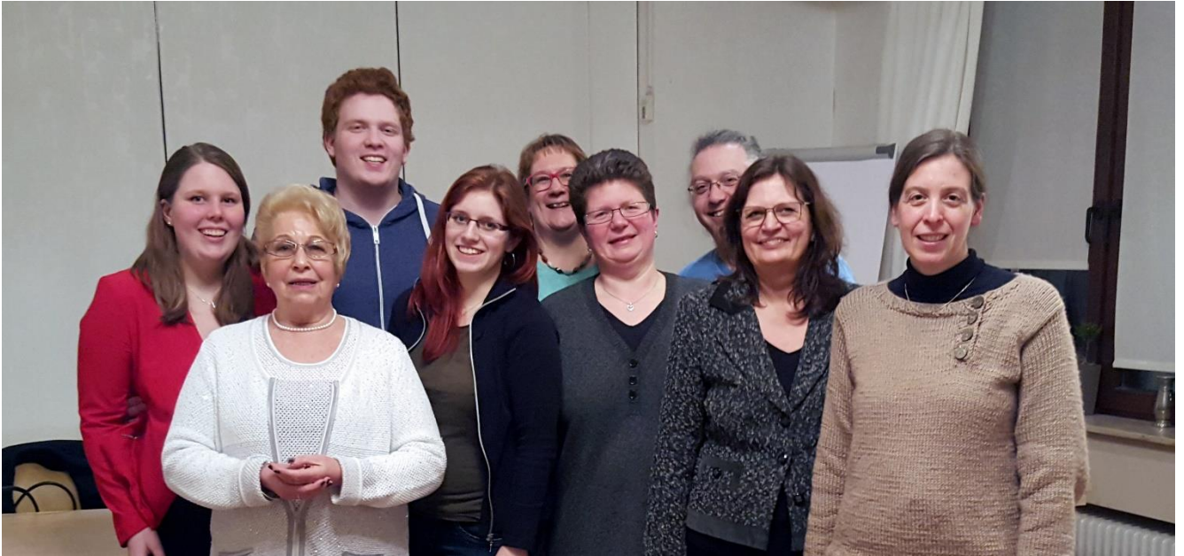
Unser Vereinsvorstand seit der Jahreshauptversammlung 2016 und geehrte Mitglieder